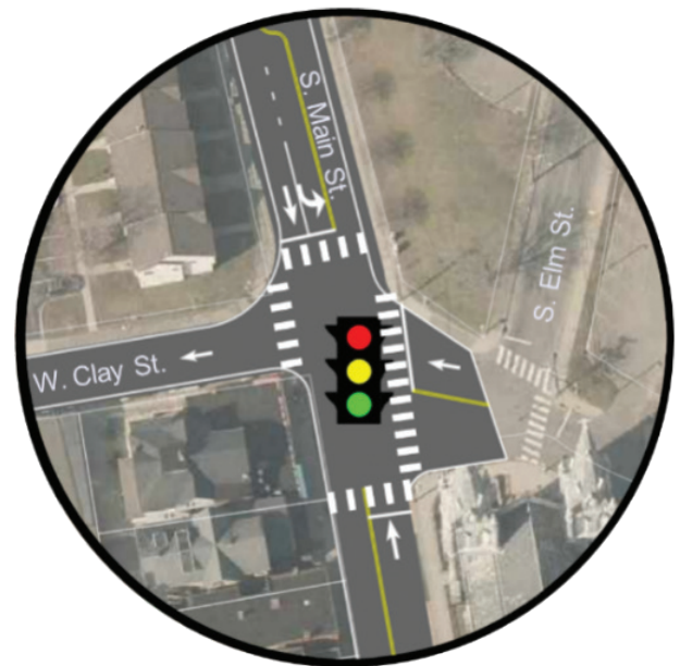
Ejemplo de mejora de una intersección

Para obtener más información, póngase en contacto con: